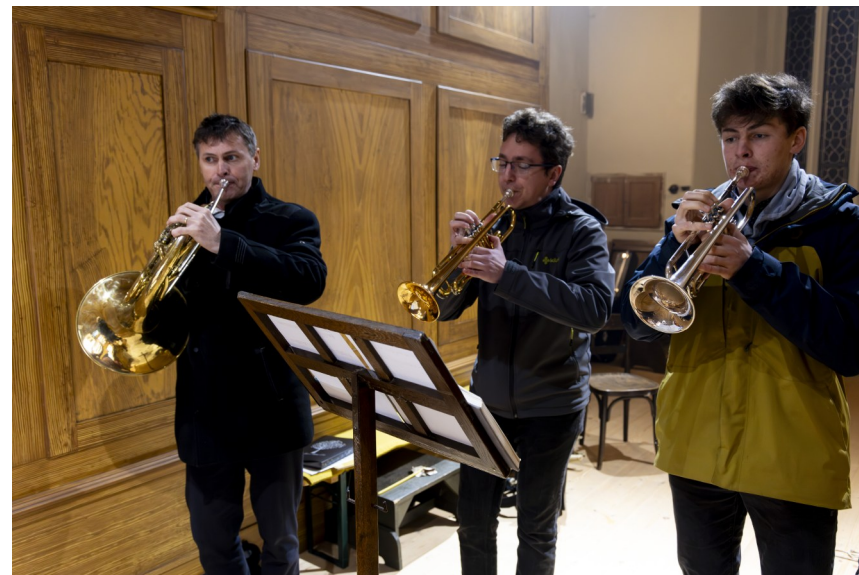
Ještě Velikonoce 2024, více fotek na farnostpolicka.cz